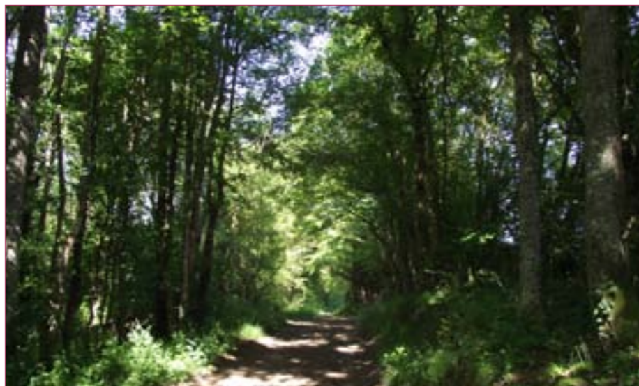
L'aménagement du territoire vise à organiser harmonieusement les activités économiques, l'habitat, les espaces naturels et les services.

En outre, la commune nouvelle a, toujours dans le domaine de l'urbanisme, mis en place, le droit de préemption sur les zones urbaines (U) et à urbaniser (AU), l'autori-