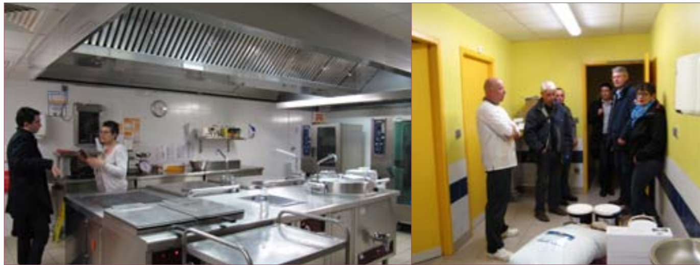
Les élus de la commune nouvelle ont visité des cuisines centrales et rencontré des responsables de ces unités. Ici, dans les locaux de la cuisine de l'EHPAD de Saint-Amand-en-Puisaye.

La commune nouvelle souhaite reprendre la maîtrise de la restauration collective sur le territoire. Pour ce faire, elle conduit un projet de création d'une cuisine centrale à Charny, qui devrait voir le jour d'ici deux ans.